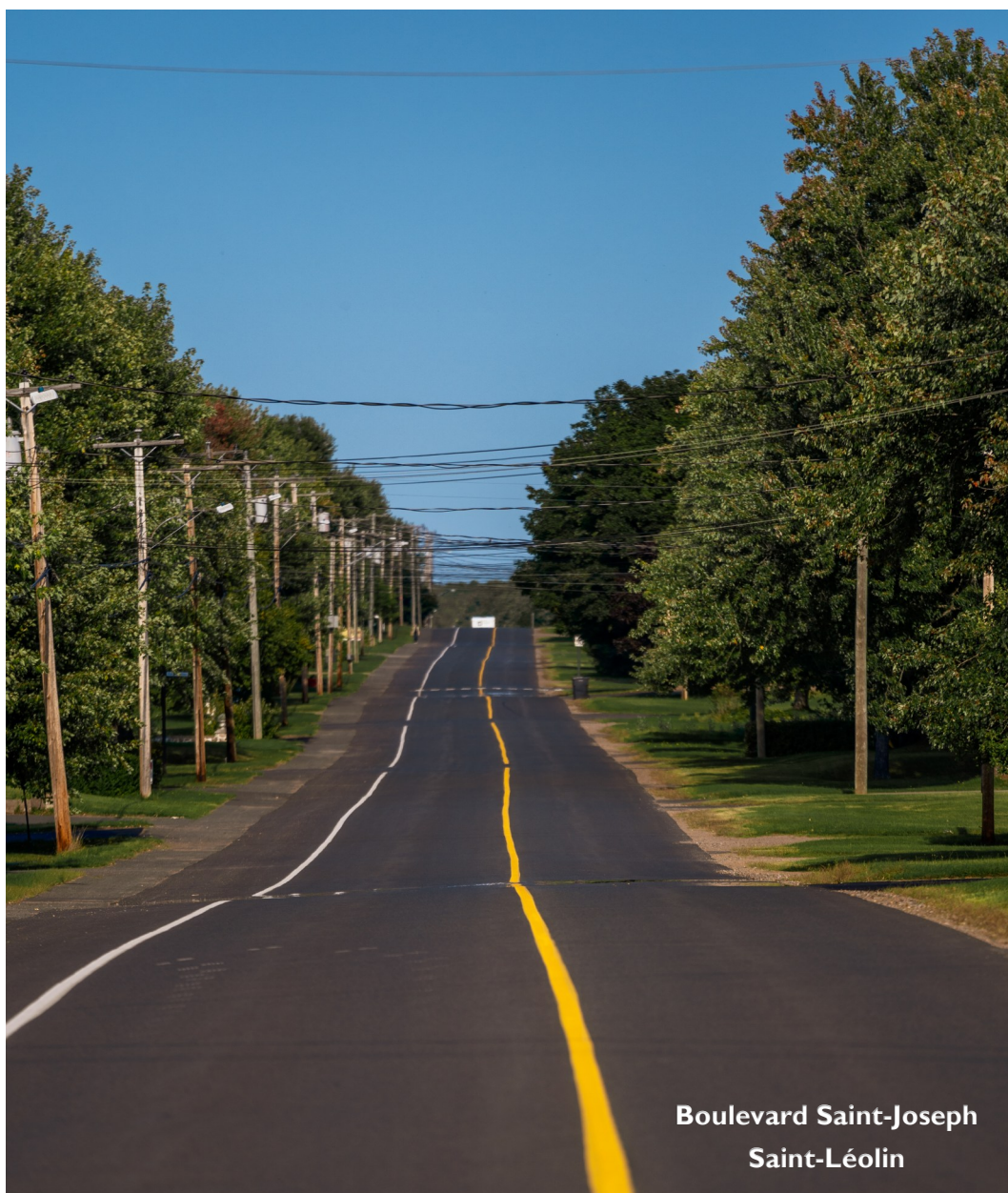
Boulevard Saint-Joseph Saint-Léolin